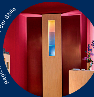
Regioklinikum Raum der Stille

Termin 4: Donnerstag, 16. Mai 2024, 19 Uhr, Dauer ca.1,5 Std.