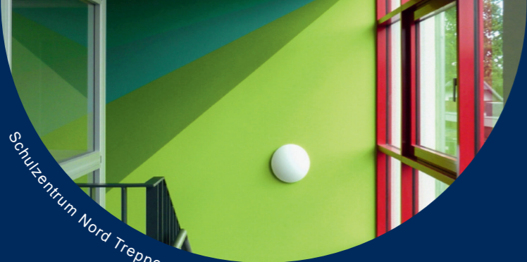
Schulzentrum Nord Treppenhaus

Tour 1: Donnerstag, 2. Mai 2024, 12 Uhr, Dauer: ca.1,5 Std.