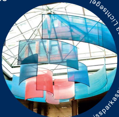
Kreissparkasse Pinneberg, 2003 Lichtsegel

Kostenbeitrag je Rundgang/Veranstaltung 8,-- €