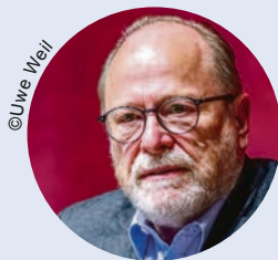
Jan Philipp Reemtsma

Nach der Anmeldung erhalten Sie einen Link zum Online-Treffpunkt.